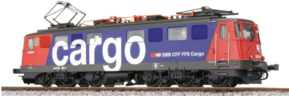
31532 , E-Lok, H0, AE6/6, 610 487-1 Langenthal, rot/blau, Ep. V, DC/AC