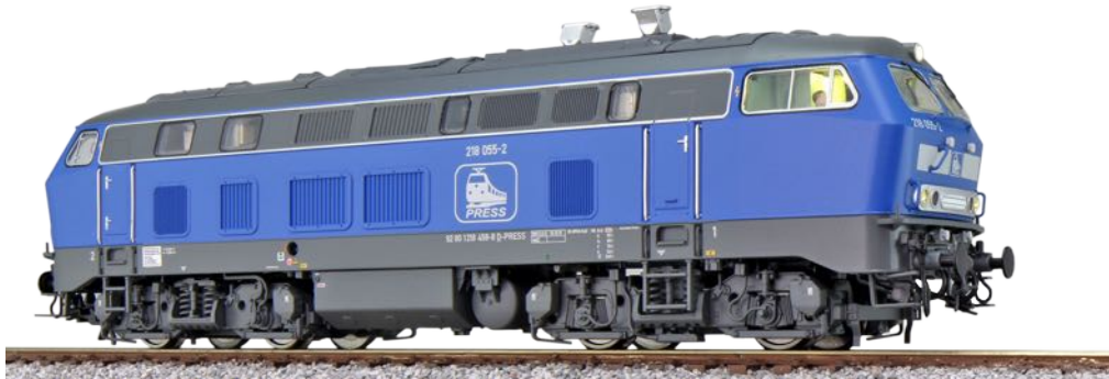
31009 , Diesellok, H0, BR 218, 218 055 Press, blau, Ep. VI, DC/AC