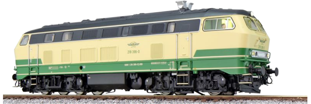
31008 , Diesellok, H0, BR 218, 218 396 Brohltalbahnhof, beige/grün, Ep. VI, DC/AC