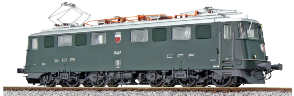
31536 , E-Lok, H0, AE6/6, 11447 Lausanne, grün, Ep. IV, DC/AC