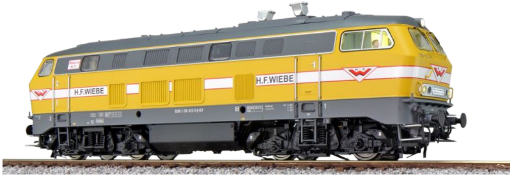
31003 , Diesellok, H0, BR 216, 216 012 Wiebe, gelb, Ep. VI, DC/AC